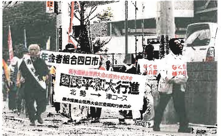
核兵器廃絶を訴えて歩く参加者たち＝桑名市で

核兵器全廃を訴える 原水爆禁止国民平和 行進が十二日、桑名市 から四日市市にかけて